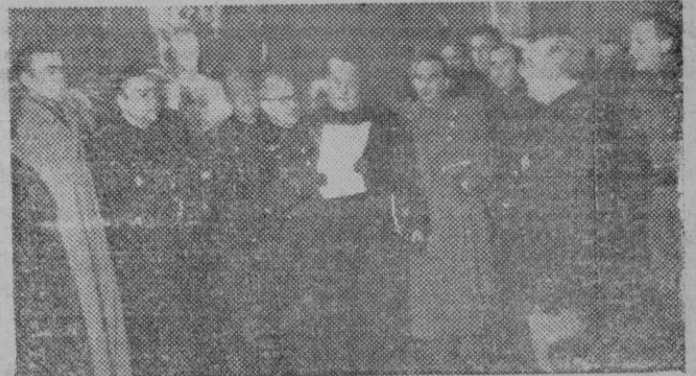
S. E. el Jefe del Estado recibe a la Comisión de ferroviarios que fué a ratificarle su gratitud y adhesión por las mejoras sociales que les ha sido pensado.