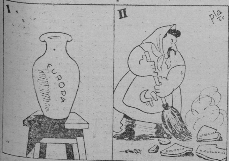
—Era un bello jarrón que se rompió...