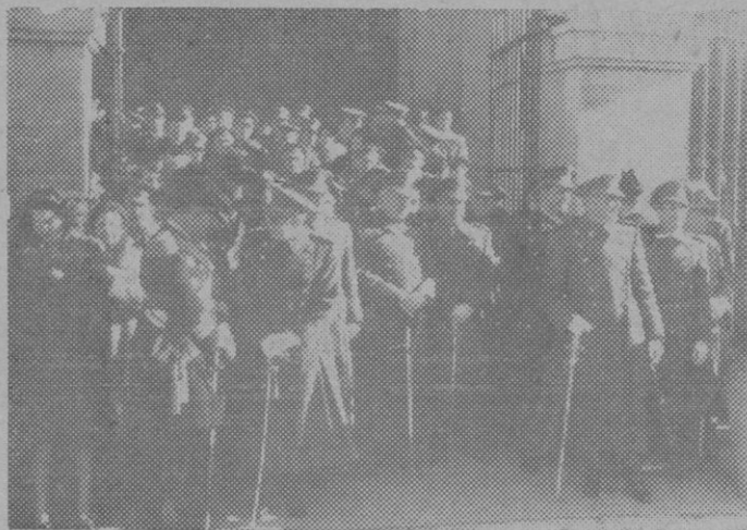
El Ministro del Ejército y otras altas personalidades militares salen del templo de San Francisco el Grande después de asistir a la ceremonia religiosa celebrada con motivo de la festividad de la Inmaculada Concepción