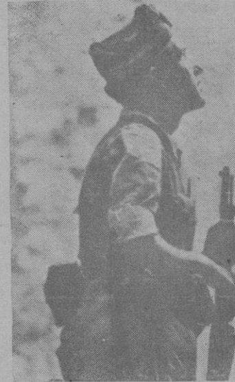
A pie firme sobre el campo y oteando el horizonte labraron su ejecutoria los soldados de la gloriosa Infantería española

Agricultura: Orden organizando el servicio nacional del cultivo y fermentación del tabaco, que tendrá a su cargo todas las cuestiones técnicas, administrativas y de todo orden que tengan relación con el cultivo, curación, fermentación y valoración de tabacos indígenas y aprovechamientos secundarios de los mismos. CIFRA