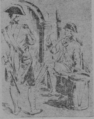
Infantería (Fernando VI) (Dibujo por J. Bernal).

En 1534, la Infantería usaba chupa, trusa y gorra o boina grande adornada con plumas amarillas y encarnadas; es decir, con los colores heráldicos de los escudos de Castilla y de Aragón, precursores de la bandera nacional.