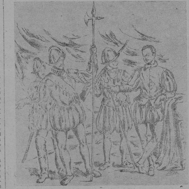
Piqueros y arca bucosos. Siglo XVI (Dibujo por J. Bernal).

En el siglo XIII, la Infantería usaba la cofia de armar e iba cubierta de cota de malla de acero, llevando este equipo