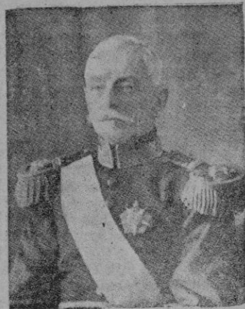
El General Carmona, Jefe del Estado portugués

En la corrida en que tomará parte actuará también la toreadora chilena Conchita Citron, que