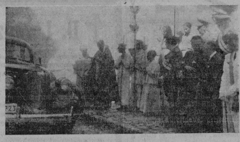
Las autoridades asistentes a la bendición de coches celebrada en la iglesia de la Merced

la iglesia de la Merced celebrada en la iglesia de la Merced