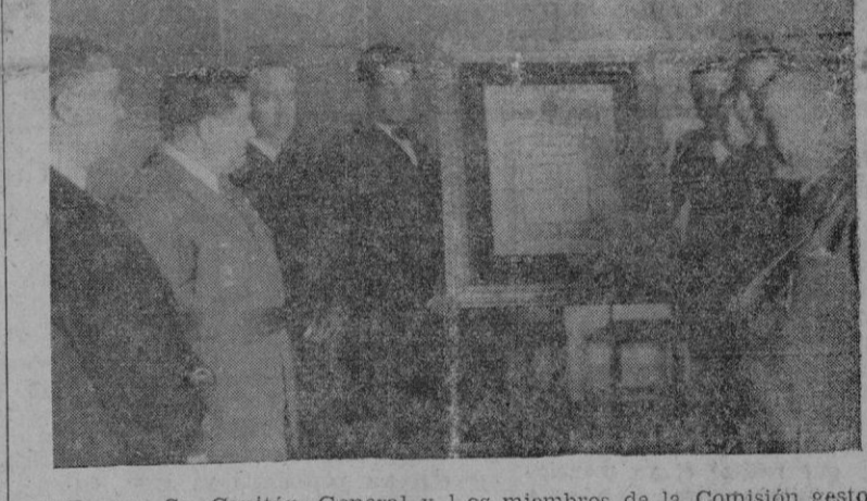
El Excmo. Sr. Capitán General y los miembros de la Comisión gestora provincial durante el acto de entrega del pergamino