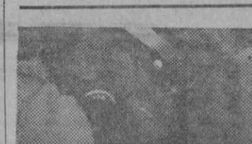
Proyecto de M. Martínez Ubago Arquitecto (De "Reconstrucción")

El pueblo de Biescas está formado por dos barrios, los de San Pedro y San Salvador, unidos por un puente municipal sobre el río Gallego.