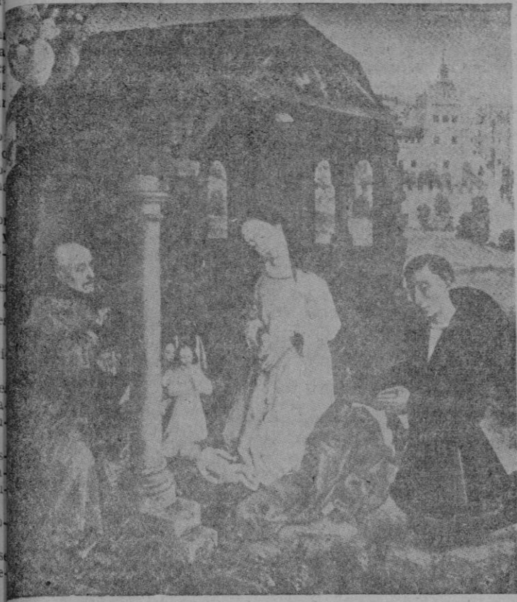
Natividad (Pintura de Roger Van der Weyden)

SECCIONES: BOMBA, TELEFONOS, REDACCION, 1977, ADMINISTRACION, 2383