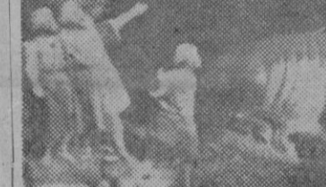
La construcción de un Nacimiento causa las delicias de nuestros pequeños flechas.

Como en los años anteriores, mañana, fiesta de Navidad, se publicará "CORREO DE MALLORCA".