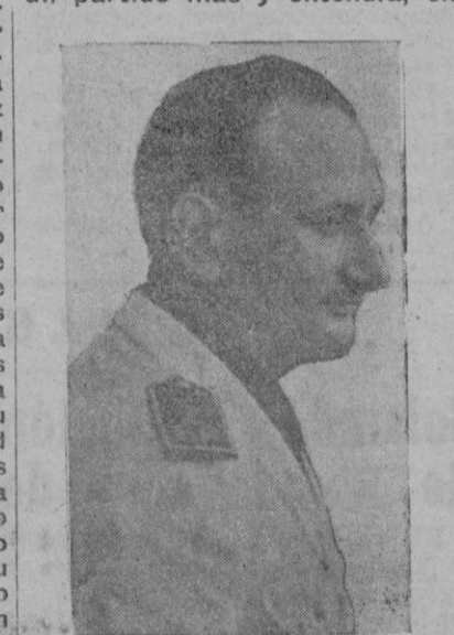
El Ministro Secretario, señor Arrese

táramos los puestos de mando y ejerciéramos desde ellos una dictadura; esto ocurrió por dos razones: primera, porque el Estado reconocía y aceptaba públicamente como suyos los fines supremos que la Falange le asignaba; segunda, porque el Estado reconocía que la Falange por su misma razón de ser y por su propia voluntad no era un partido más y entendía, en