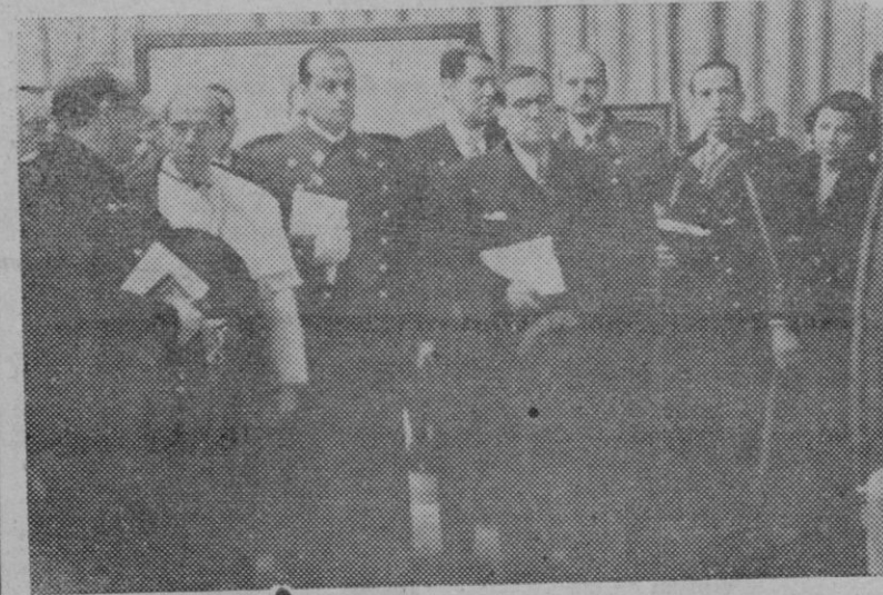
Madrid. — Los Ministros de Educación y Gobernación asisten a la Exposición de Artista, de Tenerife en el Museo de Arte Moderno

En el momento de la despedida, los médicos acampados rodearon el coche del Caudillo y le acompañaron un buen trecho.