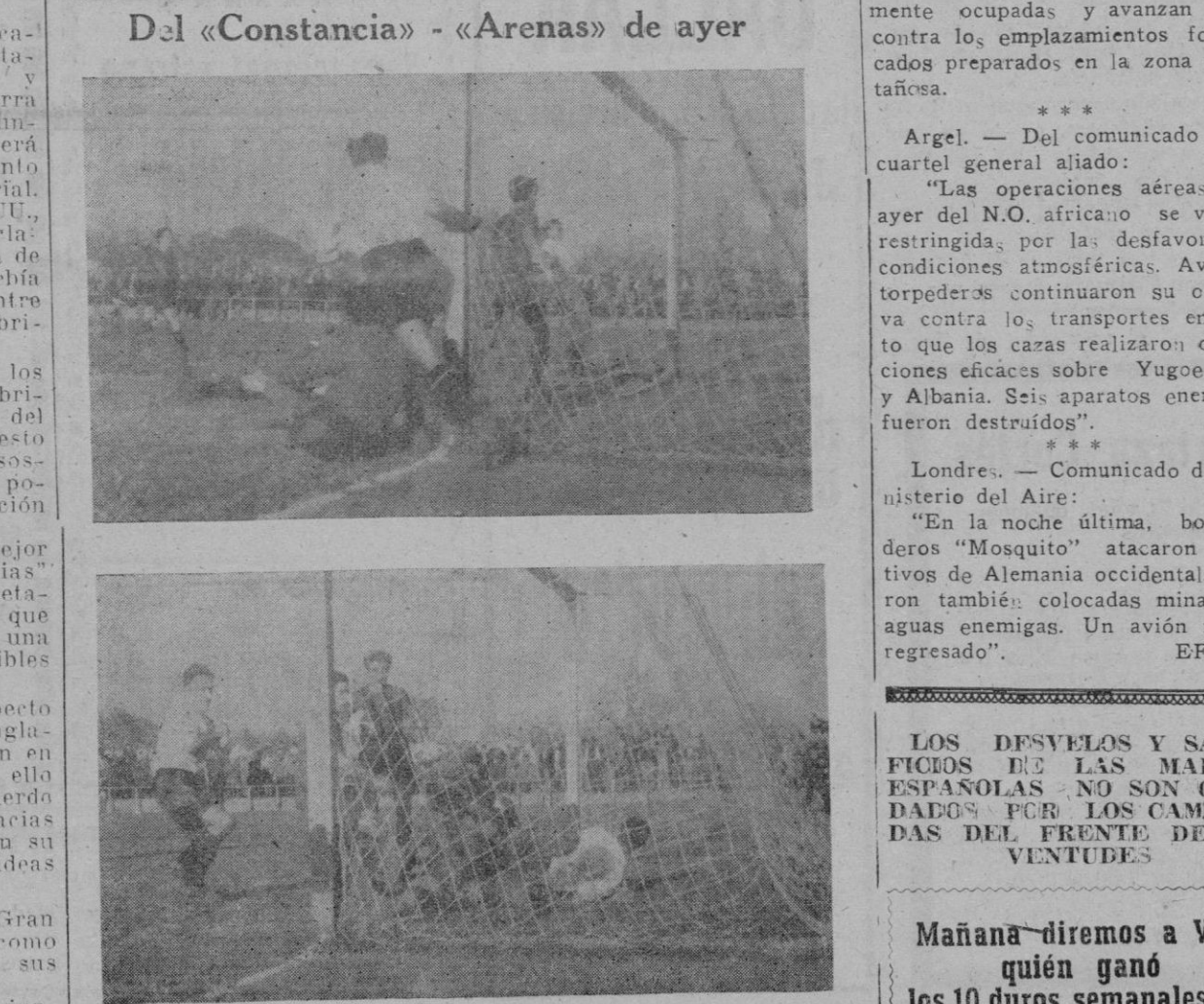
Los interesantes momentos del encuentro de ayer en que se evidenció la codicia y acometividad del equipo que va en cabeza en la II División

seis, entre ellos, un crucero, resultaron gravemente averiados.