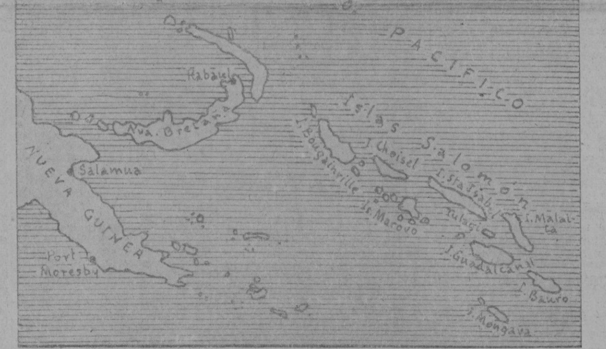
Mapa de las islas Salomón, a cuyo extremo Noroeste se encuentra la de Bougainville, donde están empeñados en encarnizada lucha japoneses y norteamericanos.

Tokio. — No se han recibido nuevos detalles sobre la segunda batalla aérea de Bougainville y se supone que la operación prosigue. Según opinión de los medios militares japoneses, los norteamericanos han sufrido tan enormes pérdidas, que se habla ya de un segundo Pearl Harbour. Los norteamericanos desembarcaron tropas en dos puntos de la costa Suroeste de Bougainville, cerca del cabo Torikina, y al Sur de Hamon, pero la violenta contraofensiva de los japoneses no ha permitido a los norteamericanos obtener el resultado decisivo. A pesar de que intentaron