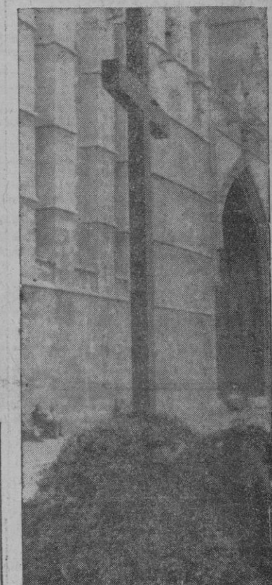
La Cruz de los Caídos es más que un símbolo; es un recuerdo permanente

Ramiro Ledesma Ramos, fundador de las J.O.N.S., alma apasionada ante los criminales atentados contra la unidad española, corazón encendido en ansias de una sociedad justa y de una