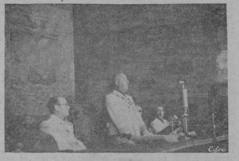
S. E. el Jefe del Estado preside la inauguración del curso universitario en el paraninfo de la Facultad de Filosofía y Letras de la Ciudad Universitaria. — S. E. el Generalísimo Franco durante su discurso.