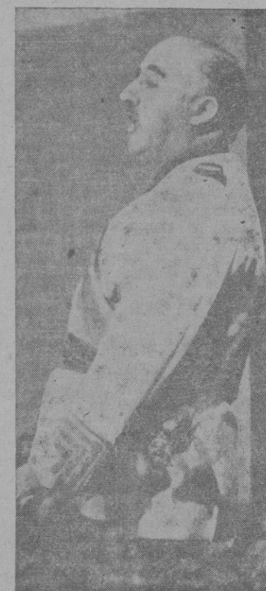
las armas decida en la contienda. Asistimos desde hace varios lustros al despertar de una nueva era de inquietudes sociales, que la guerra no hace más que acelerar. De aquí nuestro

Veinte años de propaganda del falso paraíso bolchevique y de abandono por los gobiernos de los acuciantes y hondos problemas sociales, empujan a los pueblos hacia la más horrenda de las barbaries, independientemente de lo que la suerte de