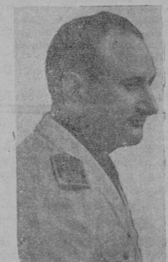
El Ministro Secretario del Partido