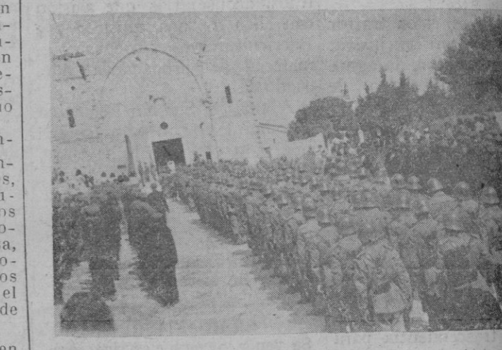
Las fuerzas de infantería y las milicias del Partido asistieron al Santo Sacrificio