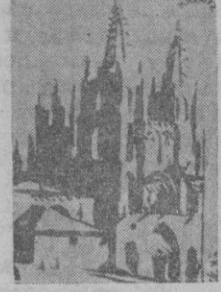
La Catedral de Burgos.

Inmediatamente desfiló ante el Caudillo la vistosa cabalgata, dando comienzo seguidamente los torneos. Doce caballeros rompie- ron lanzas ante S. E. el Jefe del Estado. Después los danzantes interpretaron bailes populares de Castilla y por último otros doce caballeros jugaron el torneo lla- mado "Bohordo", típico de Cas- tilla, que consiste en romper cas- tillos con golpes de lanza. Finalizado el acto, el Caudillo abandonó el campo siendo acom- pañado por la muchedumbre. Los miembros del Frente de Juventudes, que habían llegado precedentes del campamento "Sancho el Fuerte" de Pamplona, siguieron largo rato a S. E. entre delirantes aclamaciones.