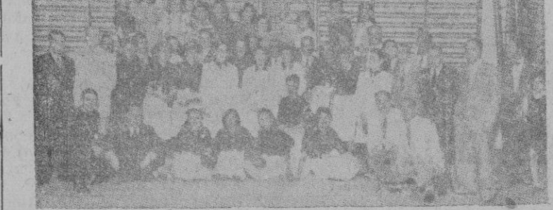
He aquí al equipo de la Sección Femenina balear y el masculino del "Gimnasia Club Juvenil" de Madrid con algunos federativos, en una de las salas del "Gimnasia Club Português".

Reproducimos hoy dos notas gráficas de la estancia en la capital lisboeta de las falangistas mallorquinas y demás representantes españoles.