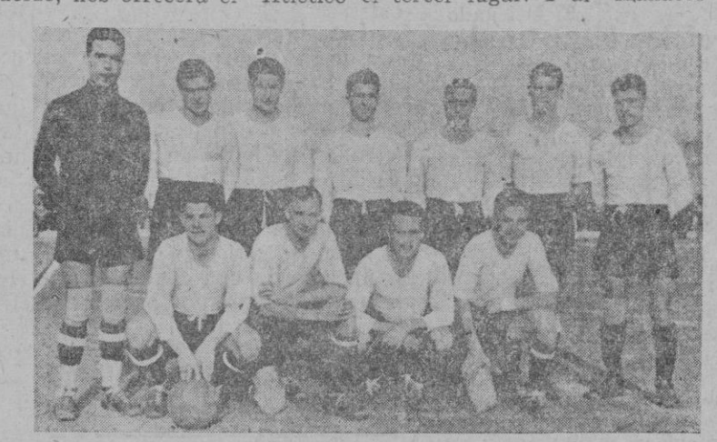
El equipo del "Granollers", campeón de Cataluña, que mañana disputará al "Atlético Baleares" interesante partido.

En La Puebla estará en disputa el tercer lugar. Y al "Manacor"