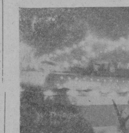
La carroza de la Marina