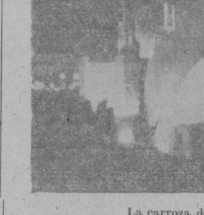
La carroza de Infantería

Abrieron marcha la sección de motoristas del Grupo de Automovilismo de Baleares, preeditada. Las motos iban vistosamente iluminadas, destacándose al trasluz los emblemas del Cuerpo de la guardia municipal monpo a que pertenecen.