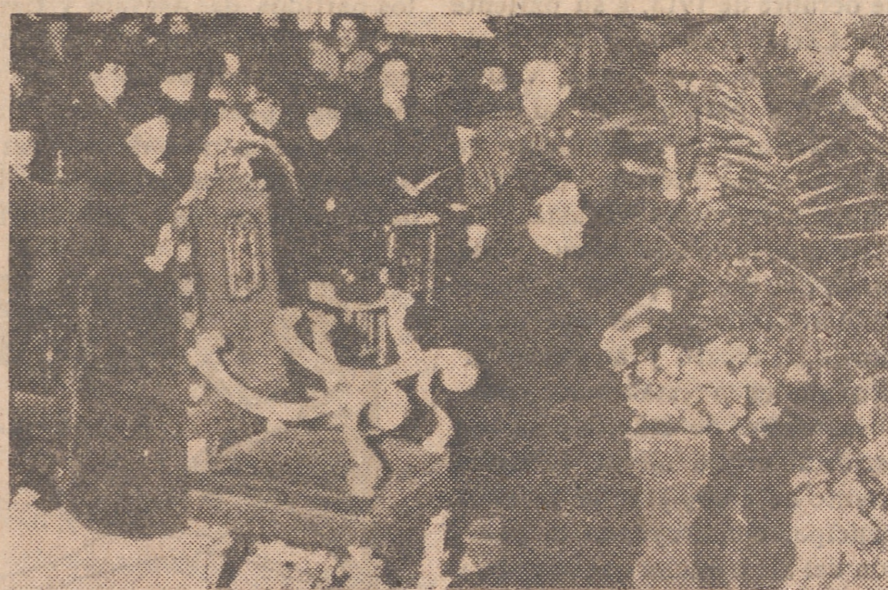
Con asistencia de la esposa de S. E. el Jefe del Estado se ha celebrado una misa en la iglesia de Santa Bárbara, Patrona de los artilleros.

Después de su llegada al Centro, la esposa del Caudillo oró unos momentos en la capilla, y después fue cumplimentada por la Comunidad. Visitó las distintas dependencias del Centro, y luego, en el salón de actos, entregó los obsequios, consistentes en una caja de bombones, una muñeca y un par de guantes. Una de las niñas dirigió unas palabras en nombre del Colegio, y otras varias recitaron poesías y ejecutaron danzas, cantándose finalmente el himno de la Infantería española.