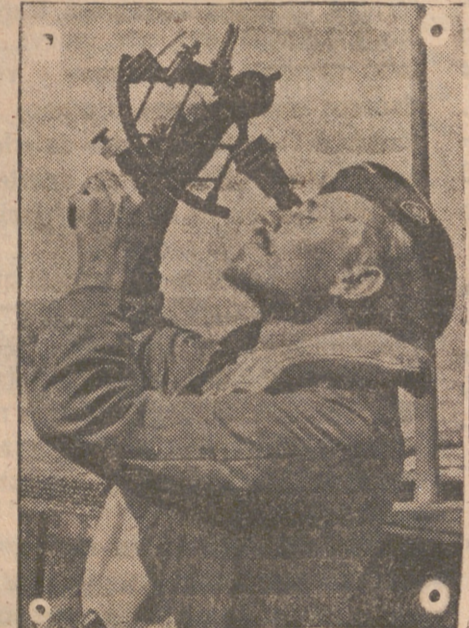
Aprovechando el sol, el comandante del submarino alemán fija con el sextante la posición de la nave.

Algo debe de haber habido importante; pero ese algo británico merced al esfuerzo magno de los soldados alemanes se ha convertido en nada. La primera parte es cierta porque las estaciones de comunicación británicas —todas ellas oficiales— con toda clase de detalles nos anunciaron la salida impetuosa del famoso octavo ejército británico con ánimo de ascender por los puertos italianos orientales o sean los que mis-