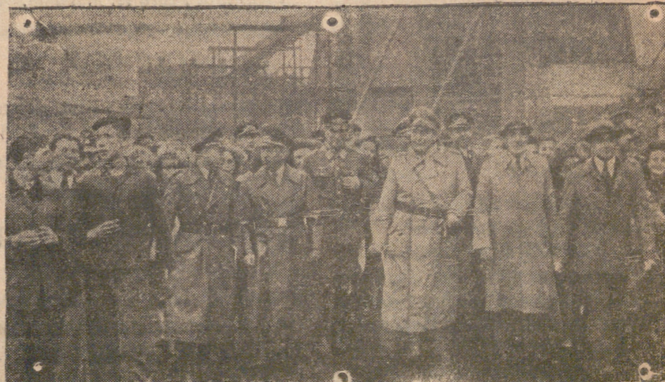
El mariscal del Reich, Hermann Goering, inspecciona en un viaje por el Sur y el Este de Alemania, las defensas antiaéreas de las fábricas de armamento.