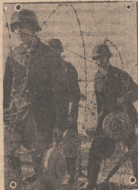
Un grupo de ingenieros alemanes va a colocar la mina número 100.000 de las que defienden la costa del Atlántico contra los intentos de invasión. (Foto «Presamundo»).

artículo que confirma lo que ayer escribimos. El «Daily Mail» con el título «Final de nuestros espectaculares actividades del verano» escribe lo que sigue: