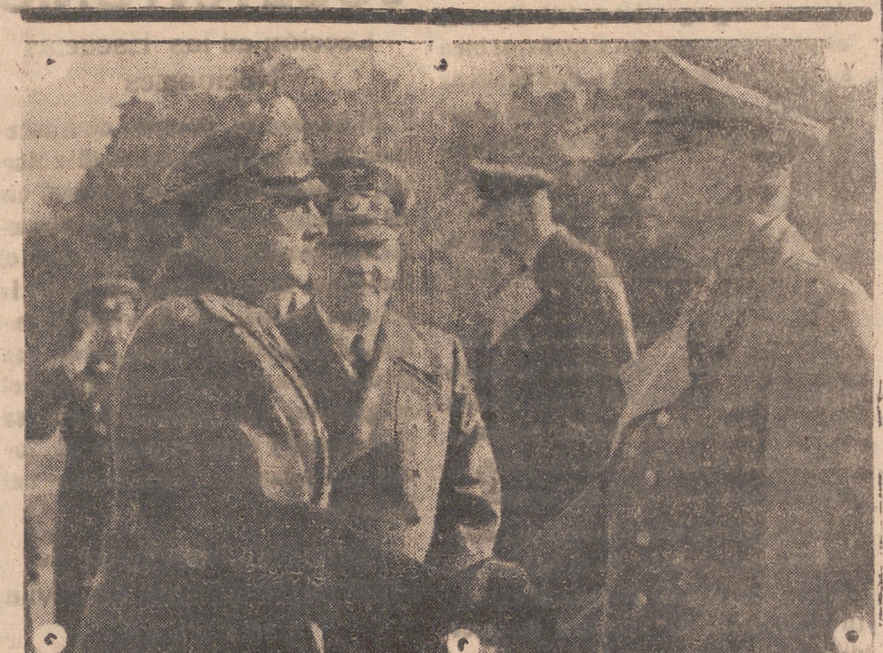
El Führer saluda al Príncipe Kiril de Bulgaria, a la llegada al Cuartel General. Le acompaña el ministro Von Ribbentrop.—(Foto «Presamundo»).

También durante la pasada noche aviones japoneses bombardearon con éxito un aeródromo de Nueva Guinea.—EFE.