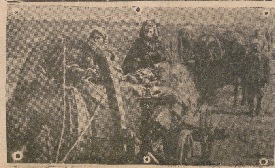
Largas columnas de vehículos con campesinos rusos abandonan los territorios que evacúan los alemanes.—(Foto «Presamundo»).