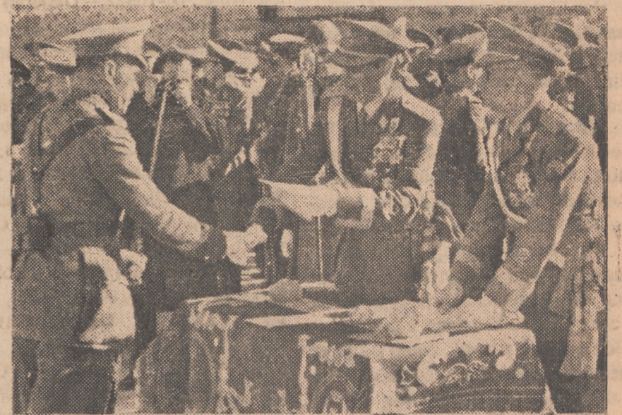
Entrega de los despachos a los sargentos provisionales del Cuerpo de Transformación en la Ciudad Universitaria.

Agrega que los rusos necesitan principalmente víveres, pero también han pedido a sus aliados con la máxima perentoriedad transportes de carbón, petróleo, semillas, abonos químicos y medicinas.—EFE.