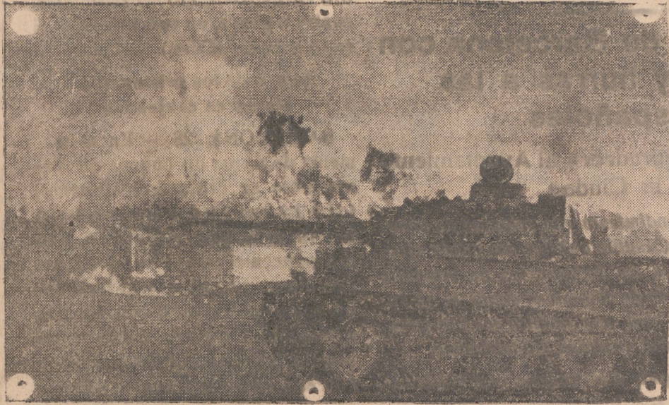
En un contraataque los tanques «Tigres» alemanes sobrepasan un pueblo en llamas.