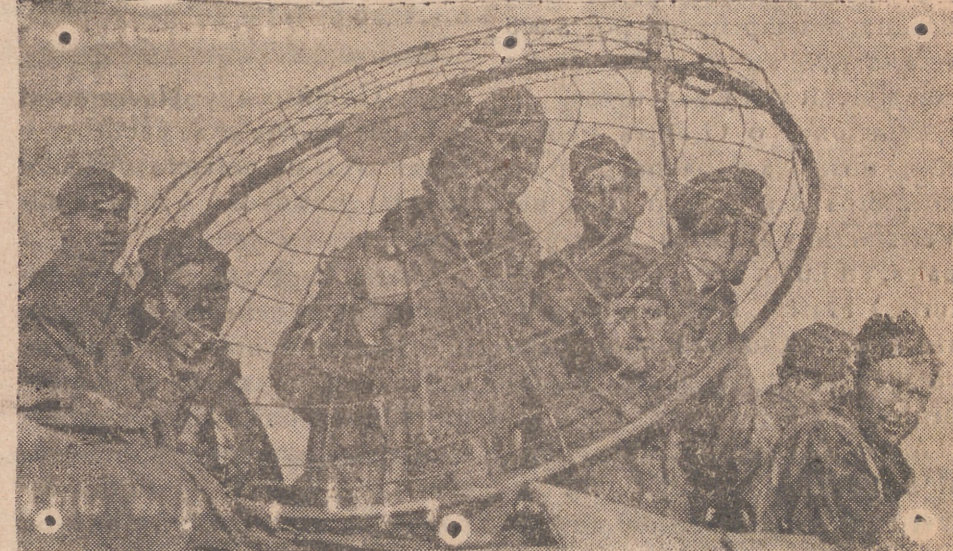
He aquí un curioso artefacto que protege a los soldados alemanos de las bombas de mano cuando luchan entre la niebla por ellos provocada.

Si las débiles fuerzas alemanas que realizan una maniobra retardataria en Italia aceptaran la batalla que constantemente le presentan los dos ejércitos del general Eisenhower, el Mando aliado experimentaría profunda satisfacción, pues nada podría favorecer tanto sus planes como poder decidir la suerte de Roma en unos momentos en que el triunfo está asegurado, pues la superioridad numérica de sus ejércitos de tierra, mar y aire es innegable. Pero ni que decir tiene que si tal batalla conviene a