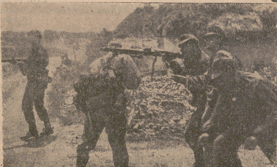
Con el fusil apoyado en la espalda de un compañero, el soldado alemán dispara contra los aviones soviéticos en vuelo bajo. Más de un opositor enemigo ha sido inutilizado por este procedimiento.

Y la ofensiva la han comenzado con toda sabiduría. Primero en cuanto al tiempo: El ruso lleva dos meses «volcando» sus reservas enormes en el Este, contra las cuales —dicen los que presumen de enterados— emplea el Reich por lo menos un cuarenta por ciento de los mejores elementos bélicos que actualmente posee. Por otra parte, Italia, parte integrante del Eje hasta el momento presente, ha sufrido una crisis grave que no puede menos de reflejarse en la disminución de su capacidad combativa. Más cosas: el estado de inquietud promovido por el anglosajón en los pueblos ocupados por el Eje, que a la fuerza absorbe buen número de soldados alemanes. Segundo en cuanto a los medios: En su plenitud, refiriéndose a los anglosajones. Bastante inferior la