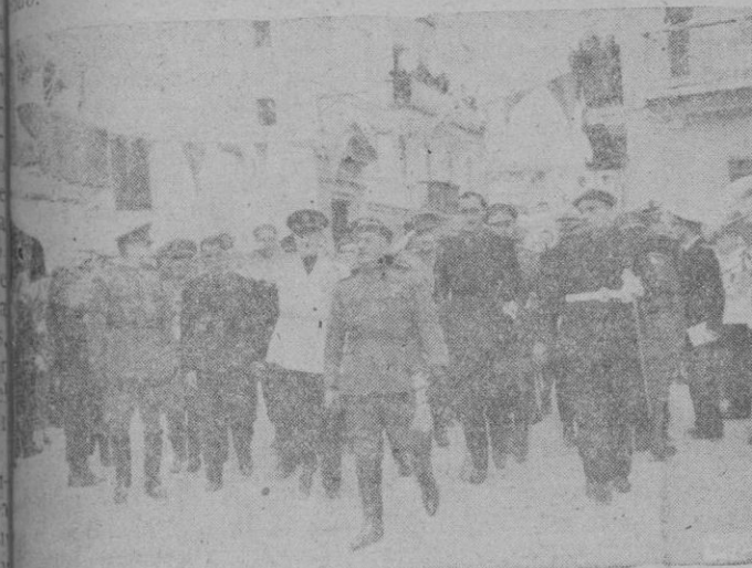
Sevilla. — S. E. el Jefe del Estado, Generalísimo Franco, llega a Ierez donde es también abieto por las entusiastas aclamaciones.