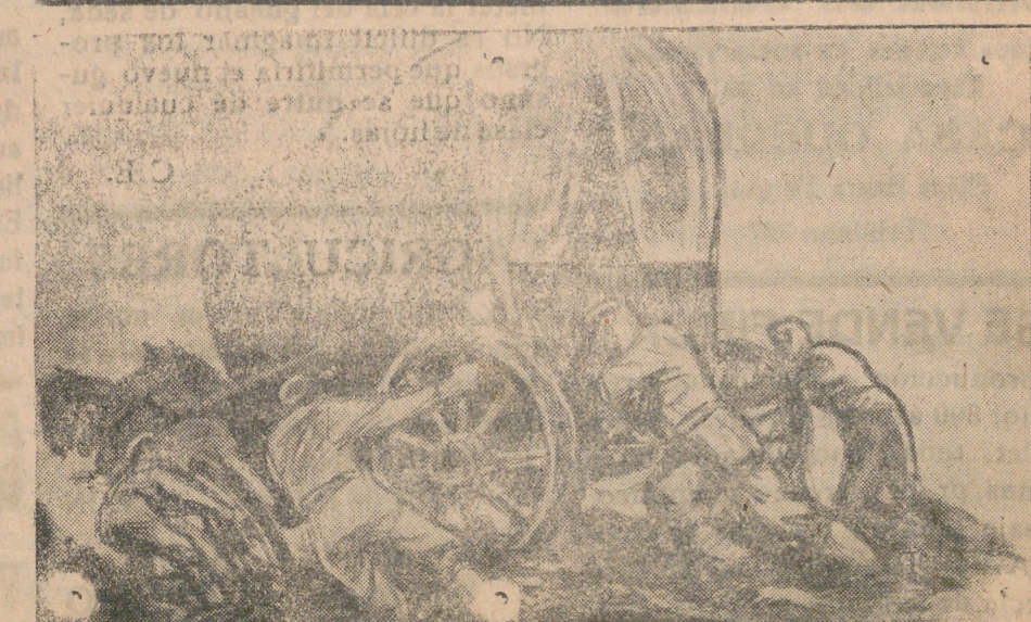
EL ESFUERZO DE TITANES EN LA COLOSAL CRUZADA DE RUSIA

BILBAO.—Esta noche el ministro secretario general del Movimiento, camarada Arrese, ha ofrecido una cena en la sociedad bilbaína a los directores de empresa, gerentes y consejeros que representan la economía bilbaína. A la cena han asistido las jerarquías nacionales que acompañan al camarada Arrese, y todas las autoridades y jerarquías de la provincia. Poco después de las doce de la noche se ha terminado la cena y se han dirigido todos a pie por la calle de Navarra y plaza de España a la Gran Vía para dejar al ministro en el hotel Carlton. En la Gran Vía ha sido reconocido por el público, siendo aclamado con entusiasmo. La manifestación ha ido aumentando, y al llegar frente a la tribuna de la Diputación, donde actuaba la banda de música de Sestao, era ya verdaderamente impresionante. Entonces la banda de música ha interpretado el «Cara al Sol», dando los gritos reglamentarios el camarada Arrese. El ministro ha continuado su camino seguido de inmensa multitud hasta el hotel Carlton, al llegar al cual la multitud cantó nuevamente el «Cara al Sol», volviendo a dar los gritos reglamentarios el camarada Arrese.—(Cifre).