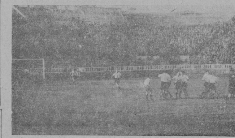
Ha sido logrado el tanto de la victoria. El júbilo incontinente de los jugadores del "Constancia" contrasta con la actitud de los vallesanos. Melcón señala el centro del terreno

Son muchas —y muy sabrosas la mayoría— las notas que del gran encuentro tenemos en el blok. El cansancio natural y las prisas por las ganas lógicas de unas horas de descanso nos relevan —¿verdad que sí?— de transcribir las íntegramente. Pro-