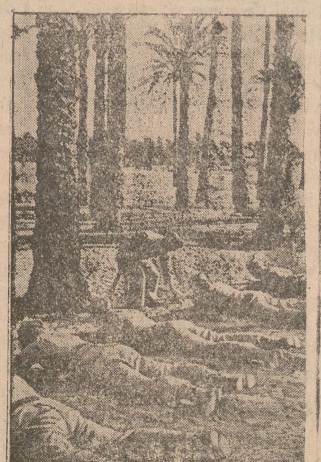
Jóvenes alemanes de las brigadas de transporte «Speer», hacen ejercicios de adiestramiento en un campamento africano.