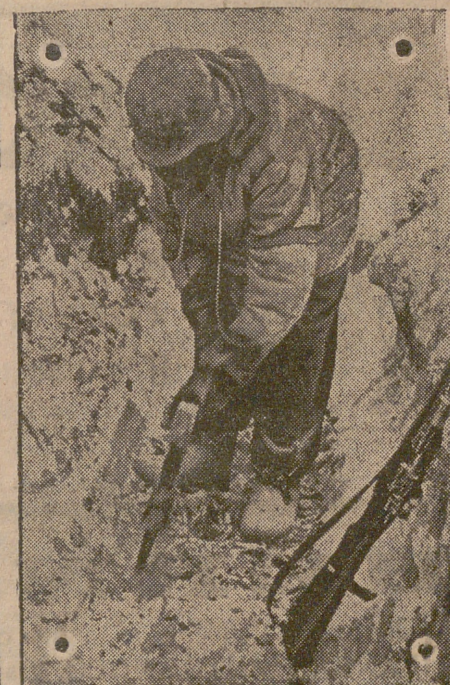
Al mismo tiempo que trabaja con el pico este soldado, ha de tener siempre dispuesta el arma de fuego contra un eventual ataque del enemigo bolchevique.

Diariamente ha de ser limpiada la trinchera de la nieve y hielo que la cubrió du ante la noche