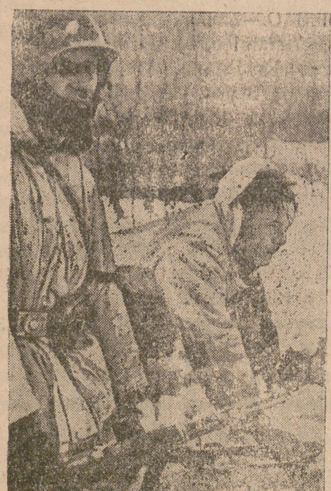
Estos dos soldados alemanes se preparan para pasar a rastras a la posición avanzada, cuyo camino está batido por el enemigo.