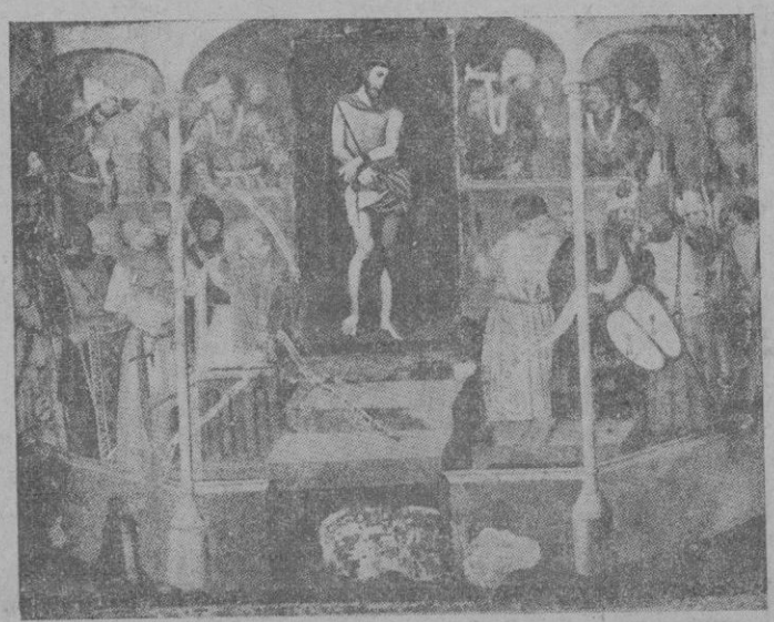
Face-Homo (pintura mural existente en la Catedral de León)