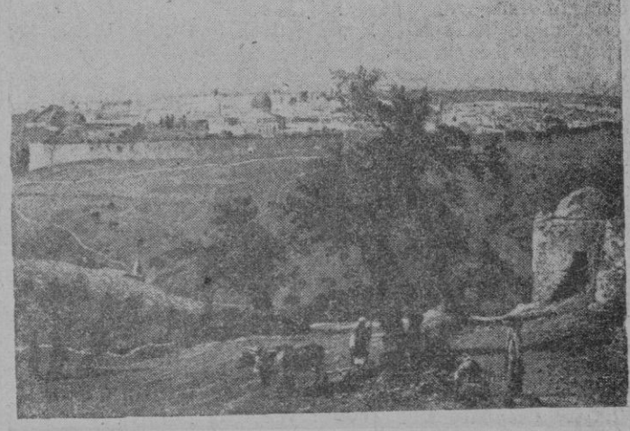
Vista de la ciudad de Jerusalem

hay tan nuestro como sus creaciones. El arte de los escultores de "pasos" que nace a mediados del siglo XVI y tiene en el XVII su apogeo, en el XVIII persevera con brio, triunfando de la rigidez neoclásica de los preceptos académicos, y aun penetra en el siglo XIX, en el cual no faltan obras excelentes dentro de la mejor tradición española. Acaso sea Valladolid, en donde Berruguete y sus discípulos habían creado una escuela en vigor y nervio pocas veces superada, donde podamos situar el comienzo de la imaginaria procesional. Es un extranjero, el burgonés Juan de Juni, el que inicia una serie de imágenes cuya teatralidad hacía aptas para ser exhibidas en la calle, a la cruda luz exterior. Son todavía tipos no muy complicados: el Cristo yacente que a la luz del crepúsculo primaveral, entre dos interminables filas de cirios, pasa por las calles haciendo conmovido a los más empedernidos con el espectáculo de un Dios muerto por amor a los hombres; la Dolorosa en su soledad, al pie de la cruz. Juan de Juni, como Alonso Berruguete, cubría la madera tallada con una policromía rica y brillante como un esmalte, y los ropajes van "estofados", esto es, totalmente cubiertos de una laminilla de oro, que se recubre con colores brillantes, los cuales, finamente rayados, dejan aparecer los vislumbres del metal con efectos de riqueza imponderable. Este arte, fundamentalmente