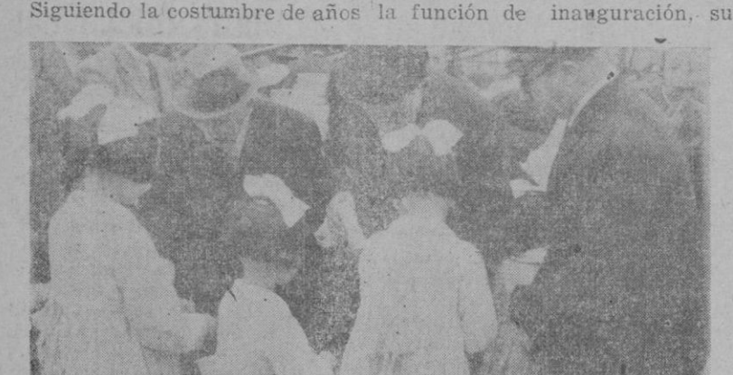
Las autoridades repartiendo golosinas a las niñas asiladas