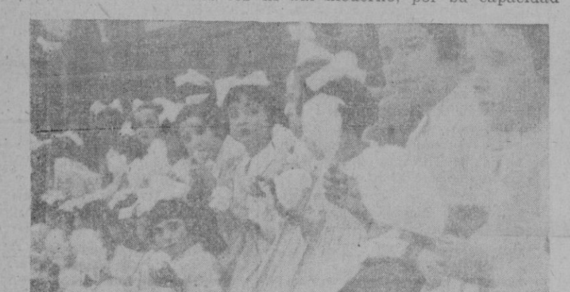
Grupo de niñas presenciando la función en el "Circo Balears"