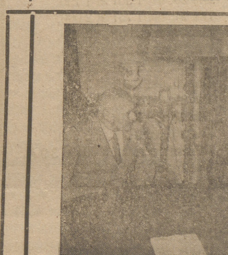
El ministro eslovaco de Gobernación Sano Mach, conferencia con el ministro alemán de Gobernación doctor Frick; a la derecha el embajador eslovaco Cernak.

Me permito esperar que en el desempeño de mi cargo contaré con el alto apoyo de Vuestra Excelencia y con el concurso valioso y cordial de su Gobierno. Formulo mis mejores votos por la prosperidad del pueblo español y por la felicidad personal de Vuestra Excelencia.