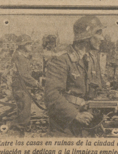
Entre las casas en ruinas de la ciudad de Stalingrado, soldados alemanes de aviación se dedican a la limpieza empleando fusiles espectales ametralladores.

RESUMEN DEL DIA: Al cabo de doce días de lucha se ha registrado el repliegue de las tropas del Eje a una segunda línea dispuesta tras algunos sectores del frente de El Alamein. La hazaña es impresionante con sólo atenerse a las declaraciones públicas y oficiales de Londres y Washington. Durante varios meses, en efecto, Inglaterra y los Estados Unidos han volcado allí todo su poderío, cuanto producen sus fábricas y cuantos hombres estaban instruidos militarmente en su vasto imperio mundial. El proyecto era «empulsar al Eje de Africa». Y un Ejército preparado para tan alta empresa ha luchado doce días para, al fin, conquistar las primeras posiciones «en algunos sectores», y aun éstas han sido ocupadas no al asalto, si-