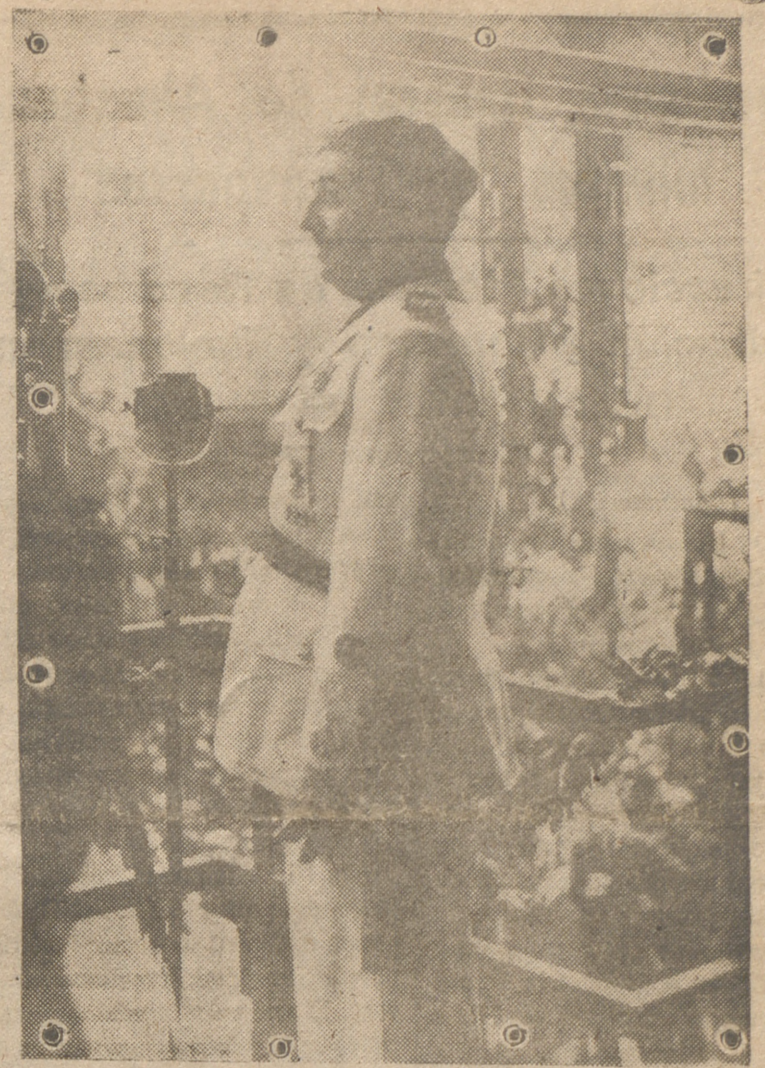
Francisco Franco, con vibrante palabra, enardecido por el fuego de su amor patrio, demanda la unión de todos los españoles, como base la más firme para consolidar la paz y segura garantía en el logro de los altos destinos de grandeza imperial española

Y tras esa política va Franco con mano firme y vigorosa, sin titubeos, sin desfallecimiento, con los ojos clavados, no en ningún interés extranjero, sino en los destinos históricos de la Patria que se formó a orillas del Ebro, a los pies de la Virgen del Pilar. Se acabaron las dudas que sabían a cobardías, se terminó el tejer y destejer, origen indudable de la decadencia internacional de nuestro pueblo. España y nada más que España, vestida, no con trajes extra-