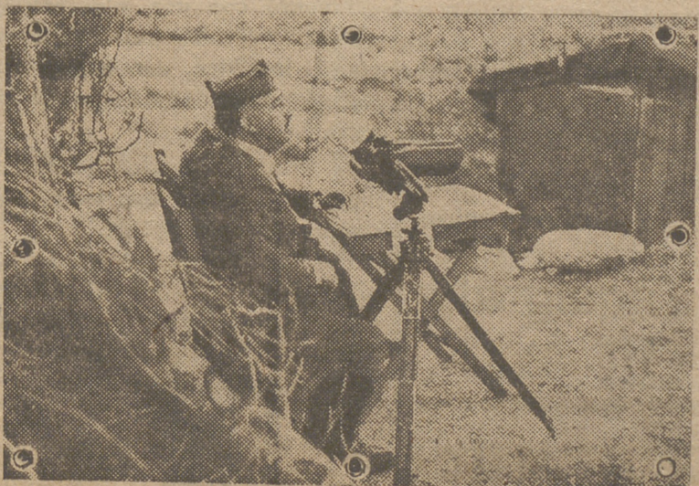
Francisco Franco, Generalísimo de los Ejércitos, forja con sapientísima estrategia las heroicas victorias y traza con firme pulso en los momentos difíciles de la gloriosa Cruzada el camino orientador del glorioso futuro de la Patria.