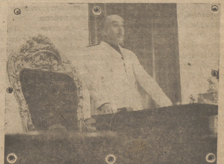
El Caudillo con diligente actividad va marcando certeras rutas de reconstrucción económica. España, bajo su égida, va saliendo victoriosa de la tremenda lucha por la normalización y consigue el triunfo de ir mejorando el aprovisionamiento, precisamente cuando en el mundo entero es la tendencia contraria la que impera.

ritual. En un lado,—el que conspiraba contra la existencia de la nación al servicio del exterior—se encontraba casi la totalidad de los recursos materiales y económicos. En el otro—la espiritualidad española hecha heroísmo y fe en la supervivencia de la nación—radicaba la pobreza, la indigencia incluso, en su economía y en sus medios para llevarla. (Continúa en 4.ª plana)