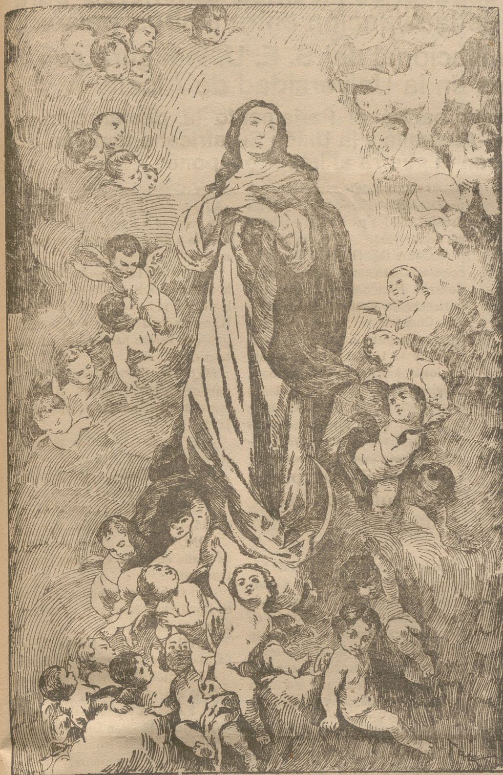
Excelsa Patrona del Arma de Infantería

con que la Infantería saluda a su Excelsa Patrona la Virgen Santísima bajo la advocación de la INMACULADA