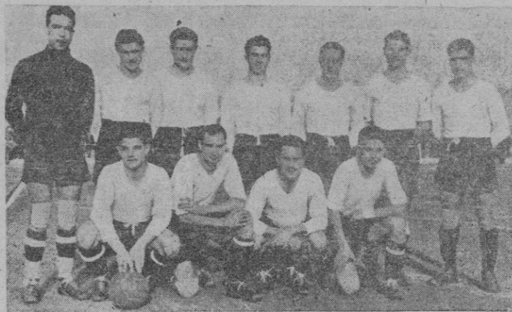
El equipo del "Granollers", campeón de Cataluña, que mañana disputará al "Mallorca" trascendental partido

Los partidos de fútbol previstos para mañana, domingo, son: