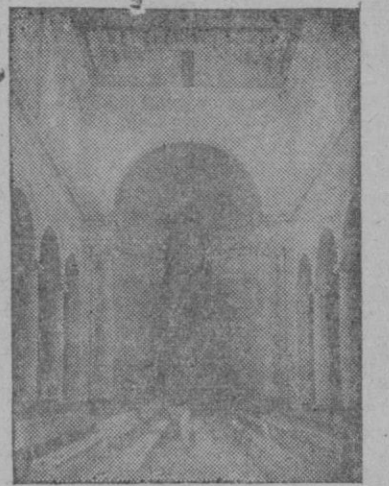
Vista del ábside y del conjunto que ofrece en el fondo de la nueva iglesia.