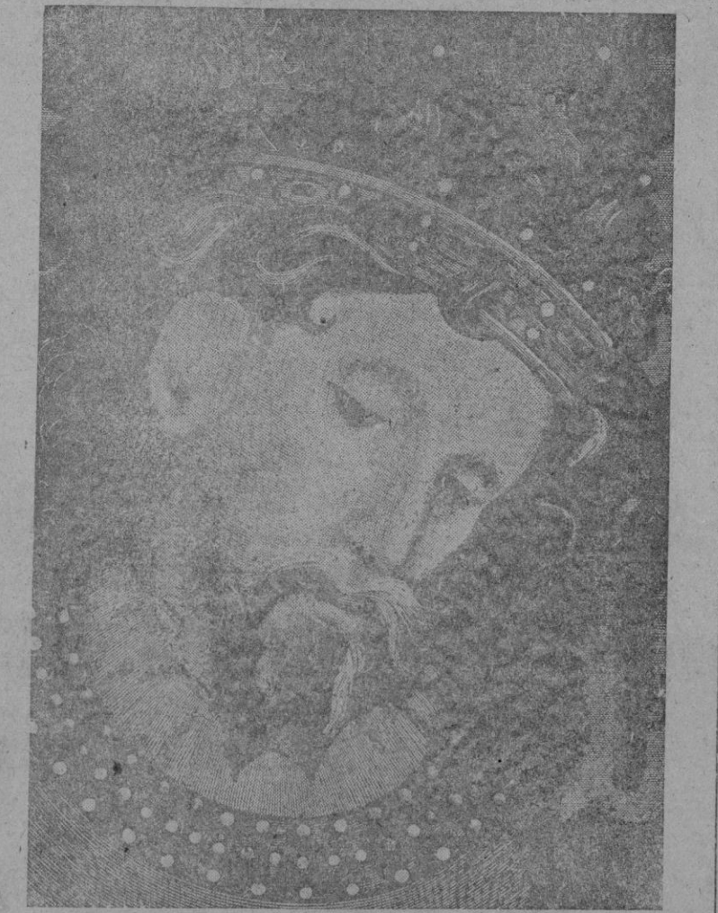
El Rey Don Jaime I el Conquistador. Pintura sobre tela, del siglo XV

Cúmplase hoy el 713 aniversario de la jornada en que las huestes de Jaime I el Conquistador incorporaron nuestra ciudad a la corona de Aragón, liberándola del yugo musulmán. Tras un sitio pródigo en episodios heroicos, los soldados cristianos irrumpieron con ímpetu irrefrenable en la plaza, desde la cual prosiguió después — durante un año casi — la conquista total de la isla. Episodio de tan singular importancia en la geografía y en la historia, viene siendo conmemorado anualmente con plausible esplendor, que impulsa y alienta el Excmo. Ayuntamiento, interpretando añejo sentir y fiel a vieja costumbre. Como siempre, tributábase hoy al "pendón de la Conquista" — colocado frente a la Casa de la Villa — los honores de ordenanza. Y ante el retrato del Conquistador desfiló el pueblo, que, entre ruidos y salvas, rinde así cordialísimo homenaje a quien supo poner su genio, su espada y su realce al servicio de las más altas empresas al grito escuadrado de "Santa María!"