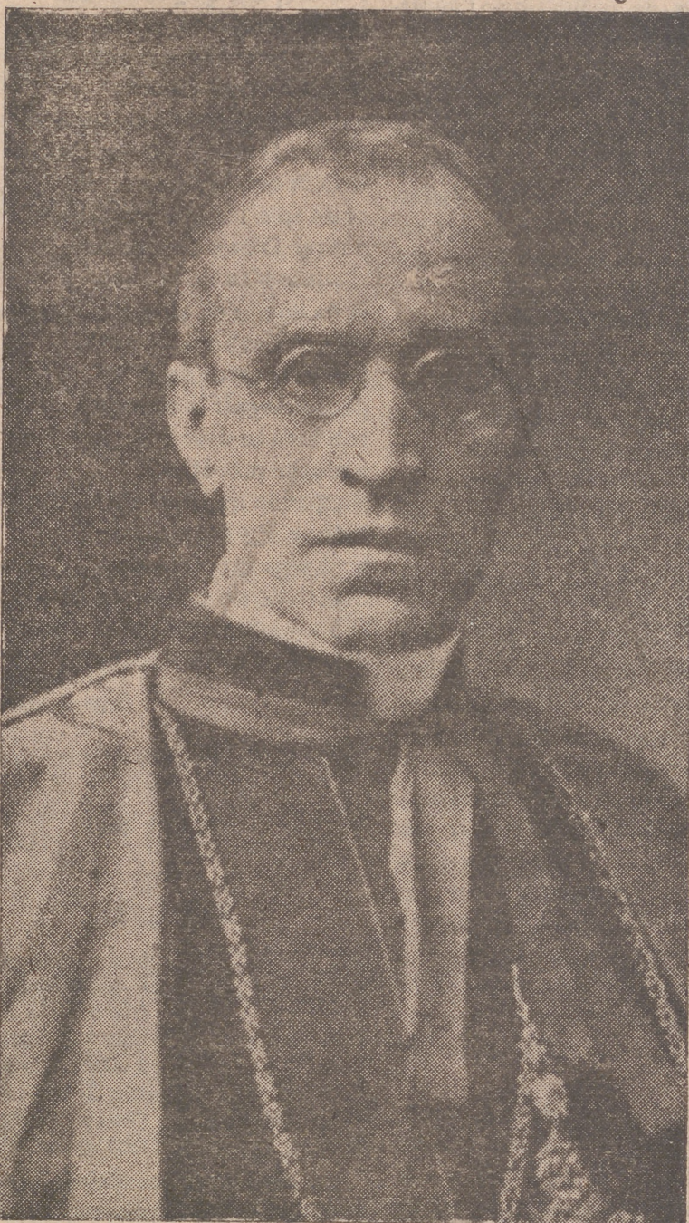
Su Santidad el Papa Pío XII, elegido para ocupar la silla de San Pedro