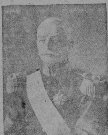
El general Carmona, jefe del Estado de Portugal

En esta suma de votos no están incluidos los de las provincias ultramarinas de Mo-