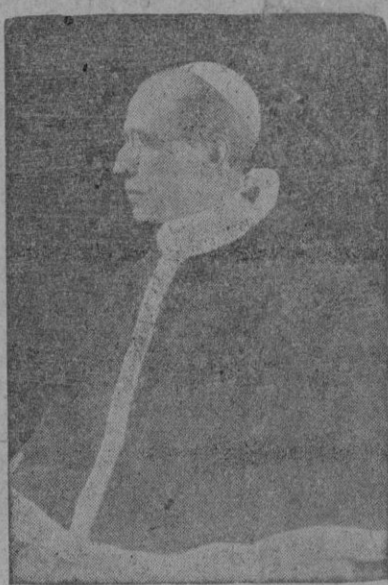
grada Forma, que es y ha sido víctima por la humanidad que yacía víctima de las garras del pecado.

«En la fiesta de hoy — añadió el Papa — que retiene de hitos ante los altares al pueblo de El Salvador y a las demás naciones centro-americanas, se adora al Señor del cual viene la única salida posible en esta hora, que está escondido bajo el velo blanco de la Sa-