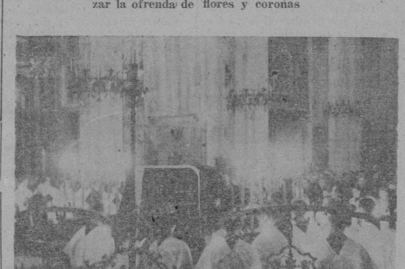
Momento de cantarse el responso, en la Catedral, después de la misa