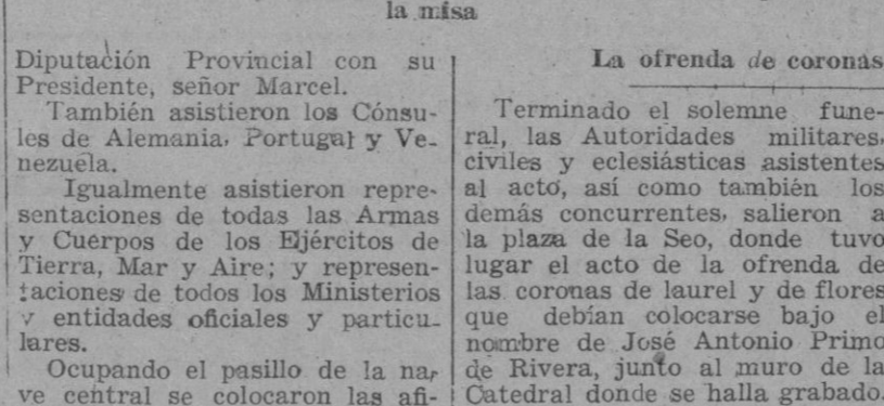
La ofrenda de coronas