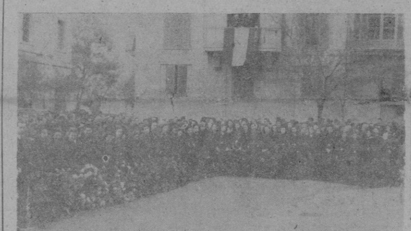
Las camaradas de la Sección Femenina, poco antes de comenzar la ofrenda de flores y coronas

Los Excmos. Sres. Capitán General y Gobernador Civil y Jefe Provincial, al ir a depositar un gran corona bajo el nombre del Fundador de la Falange