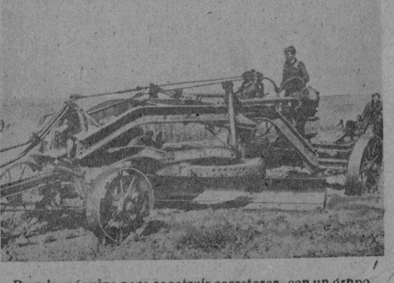
Pesada máquina para construir carreteras, con un grupo de hombres al Servicio alemán del Trabajo en el Sur del frente oriental