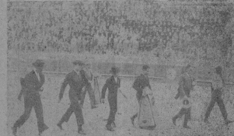
EL FESTIVAL TAURINO. Las presidentas de honor. — Los diestros durante el paseo