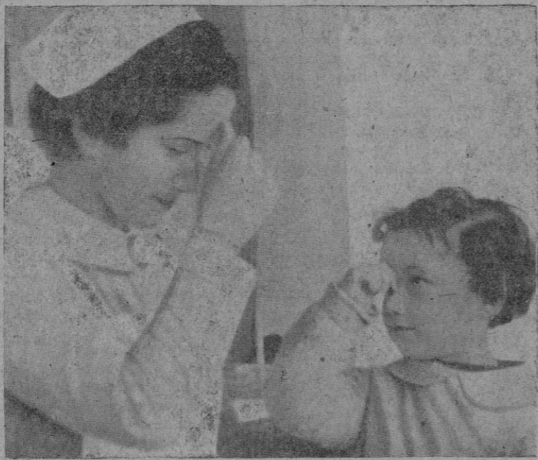
La bella estampa que se ve a menudo en los centros de "Auxilio Social": las criaturas a su tutela aprenden el más hermoso gesto, la señal bendita de la Cruz

El punto 23 del Nacional-Sindicalismo afirma: "Es misión esencial del Estado, mediante una disciplina rigurosa de la educación, conseguir un espíritu nacional fuerte y unido."