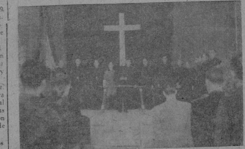
El Excmo. Sr. Gobernador Civil y Jefe Provincial del Movimiento dando lectura -- en el "Salón Mallorca", acompañado del Consejo Provincial de Falange Española Tradicionalista y de las JONS -- al discurso fundacional.