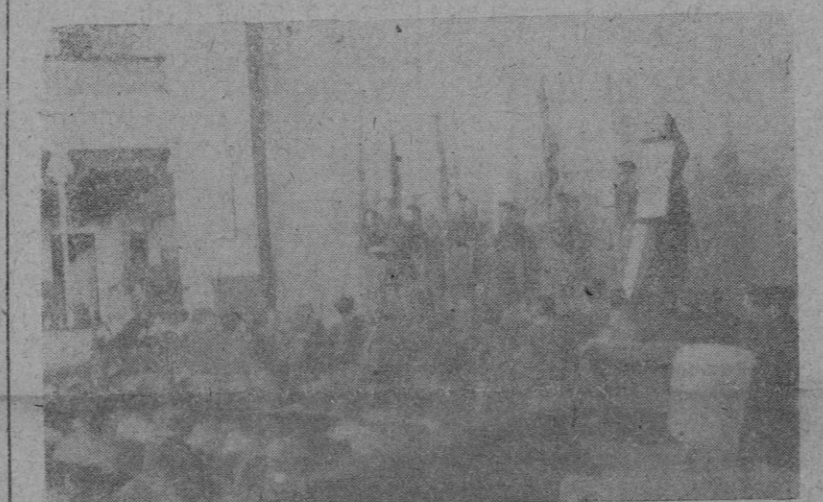
El escenario del Teatro Balear, durante el acto celebrado por el "Frente de Juventudes" con motivo del "Día de la Fe".