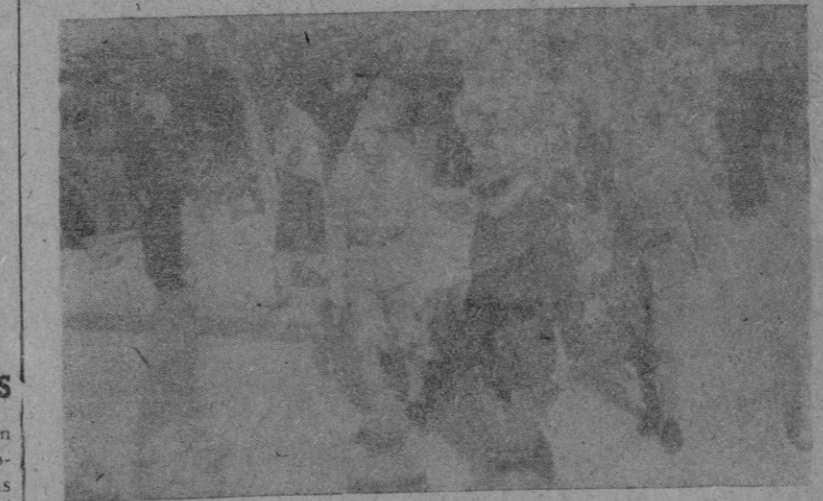
S. E. el Capitán General de Baleares al disponerse a depositar una corona de flores al pie de la Cruz de los Caídos.