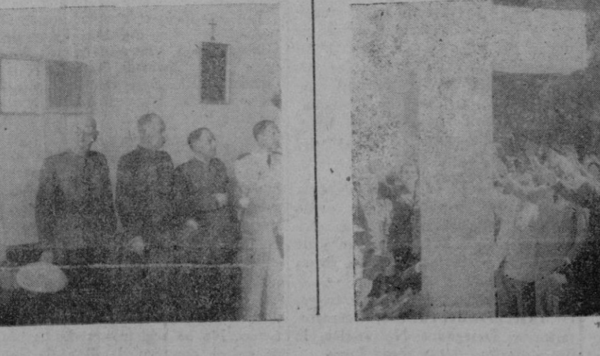
El acto de la jura y toma de posesión de los nuevos Ministros.

Llegada de Autoridades y Falangistas. Desde las primeras horas de la mañana de ayer fueron llegando a Porto-Cristo desde buen número de pueblos de Mallorca, gran número de falangistas uniformados y con sus respectivas banderas. A eso de las once fueron lle-