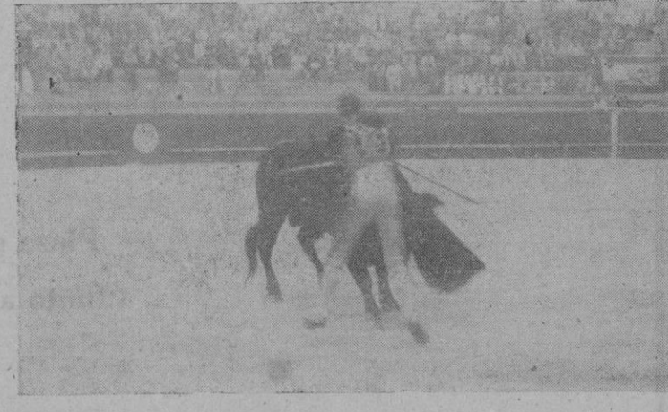
Quinito en su gran estocada en su primer toro, que le valió la oreja de su enemigo.