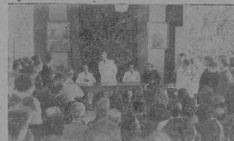
El Delegado Nacional de Sindicatos, al dirigir la palabra al personal de la C. N. S.