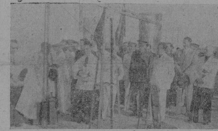
Momento de la bendición de la primera piedra de los dos grupos de viviendas protegidas que se construirán en el Molinar de Levante