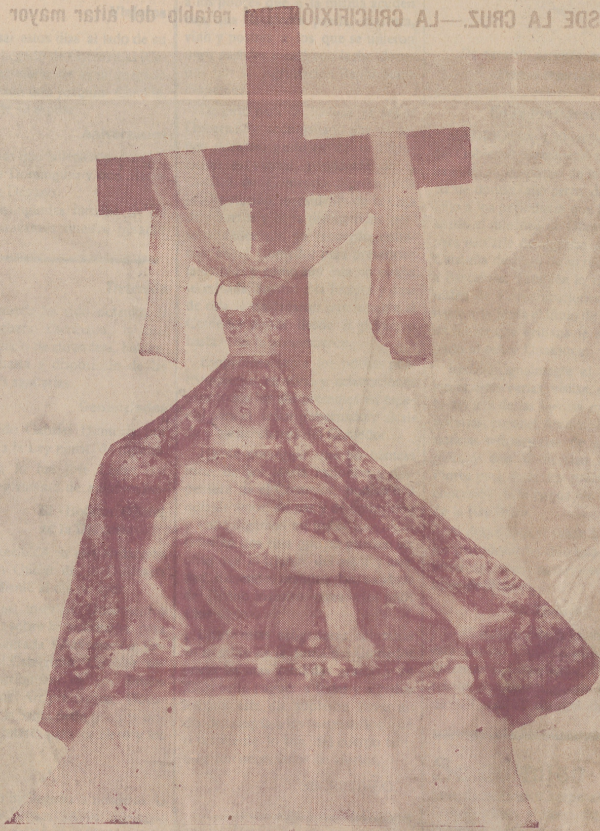
Al pie de la Cruz una mujer yace derribada, sacudido su delicado cuerpo por los espasmos del más horrible de los dolores. Madre del Salvador, también ella ha de contribuir a la gran Obra de la Redención. Su Hijo ha dado la vida; ella ha puesto en la empresa su corazón. Su corazón que ya apenas late a fuerza de recibir heridas; su pobre corazón lacerado por las espinas que han azotado a su Hijo, rasgado por las espinas con que le han coronado, atravesado por los clavos que le han fijado a la Cruz, atezado por los insultos con que se le ha ultrajado. Para el Hijo y para la Madre «El sacrificio se ha consumado».

(Hermosa escultura del imaginero castellano Gregorio Hernández, a la que se rinde culto en la iglesia de San Nicolás, de Avila)