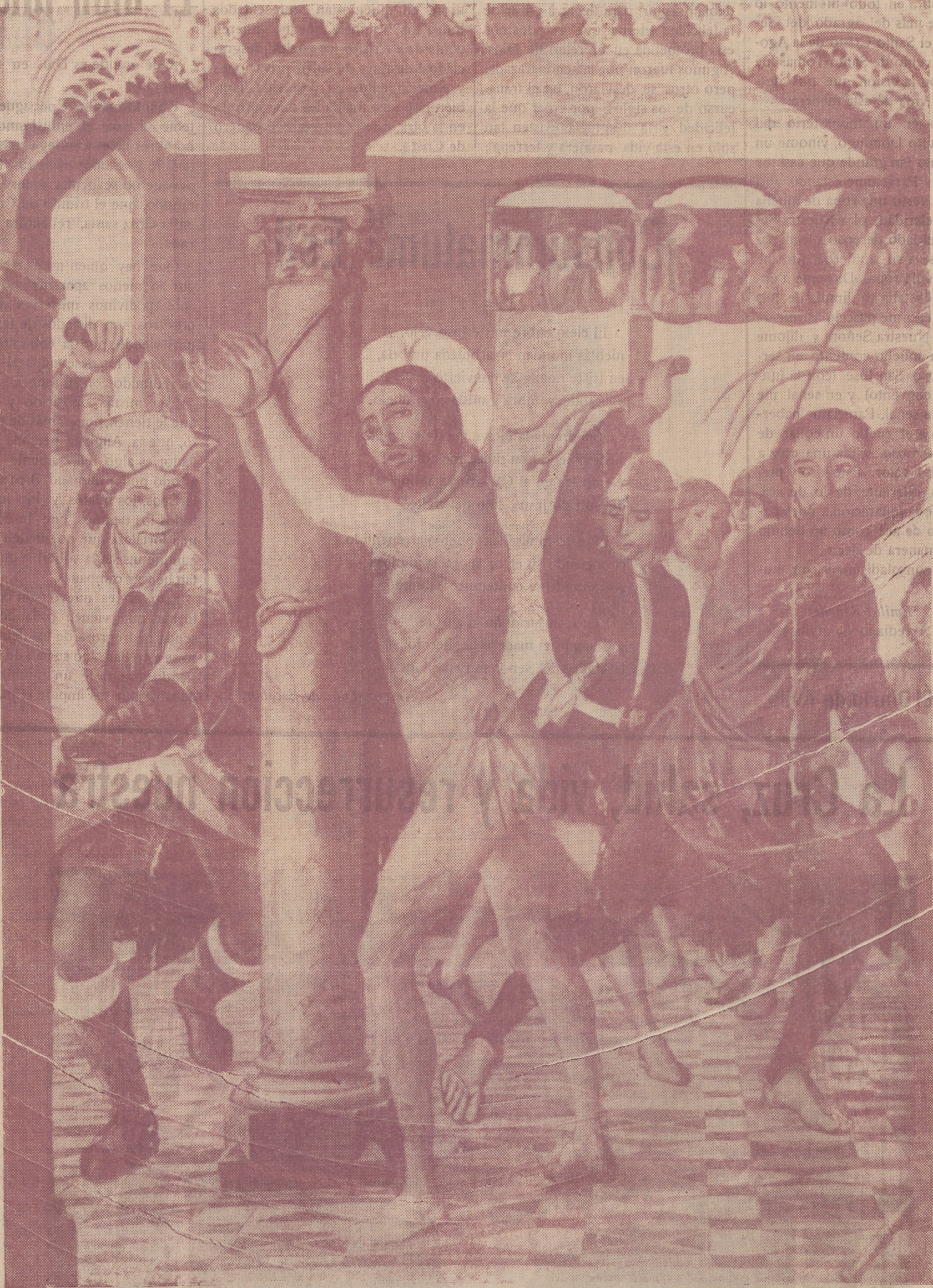
LA FLAGELACION.—Del retablo del altar mayor de la Catedral de Avila. (Berruguete)

contradicción. Bastante mayor que la de Don Quijote.