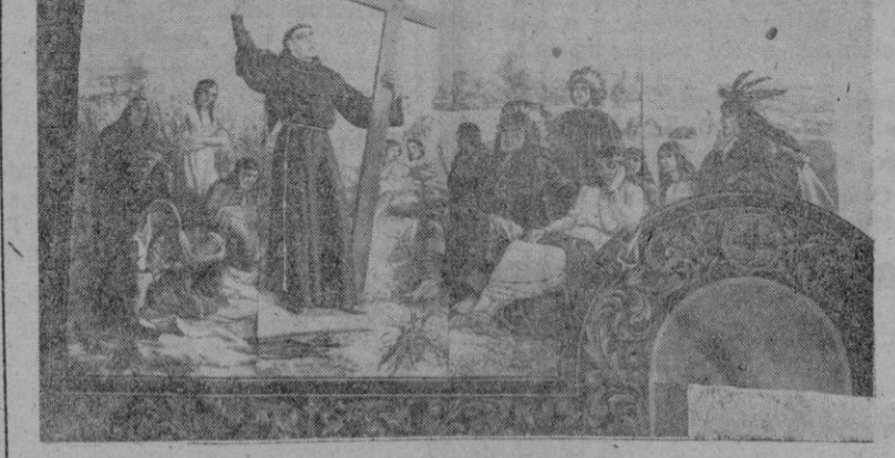
Vista parcial del cuadro que figura en la parte derecha y que representa la Misión de San José en pleno desarrollo

Auto-crítica Confieso en primer lugar que el encargo para pintar toda la decoración de la iglesia de San Francisco de Waco sobrecogióme un poco, especialmente al fijarme en las dimensiones del ábside. Una superficie de trece metros por diez, a base de composiciones originales con figuras de tamaño natural, tiene muchas