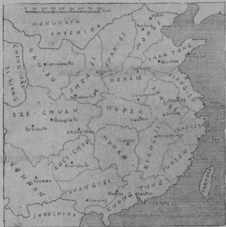
Mapa de China. La extensión de las provincias de Chekiang y Kiangsi ofrece una idea de la extensión del frente en que luchan las fuerzas japonesas. La capital de Kiangsi, Nang-chang, se encuentra a 600 kilómetros de Ning-po y 500 de Ven-cheu.

Los informes recibidos sobre el bombardeo indican la importancia de los daños ocasionados por aquel en los puntos de resistencia de las fuerzas chinas.