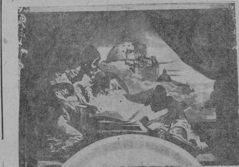
Una de las antiguas pinturas de Vich; representa una alegoría de la confección del Misal

Buena muestra de lo que va a ser esta nueva decoración la tenemos palpable en las cinco telas que Sert lleva ya realizadas desde algún tiempo. El tema de las composiciones está concebido a manera de cuadros llenos de masas y figuras, ejecutadas con el mayor relieve que puede dar de sí la pintura, con un contraste violento de claro-oscuro efectuado en tonos de grisalla sobre fondo de oro. La novedad introducida por Sert consiste en abandonar el sistema de proyectar figuras en el más allá del límite constituido por los muros,