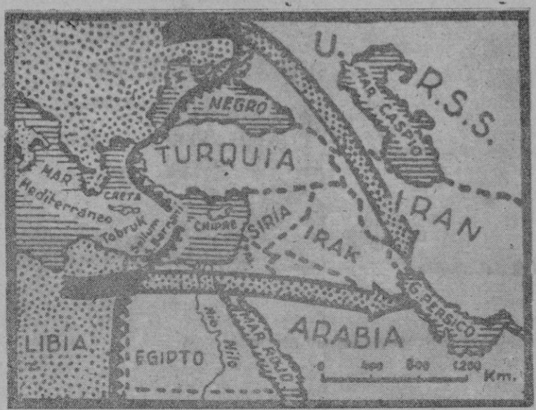
El rapidísimo avance alemán en el N. de Africa y lo mismo el iniciado en el frente ruso hacen pensar si el objetivo final de ambas ofensivas es converger en el Golfo Pérsico a través, respectivamente de Palestina y Siria y del Cáucaso

E. JUNYENT, Pro. Conservador del Museo Episcopal.