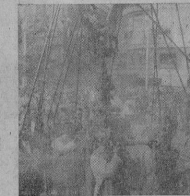
Varios aspectos de la solemne procesión de ayer