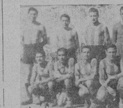
El equipo del «Manacor», campeón de Liga, que ayer en «Buenos Aires», pese a ser vencido, produjo excelente impresión. — El primer tanto del «Mallorca», que el esfuerzo de los defensas manacorinos no pudo evitar.

Los aplausos que el público tributó en varias ocasiones a este jugador, que se presentó por tanto sin tres de sus mejores elementos: Monerrat y Marcos, lesionados, y Serra.