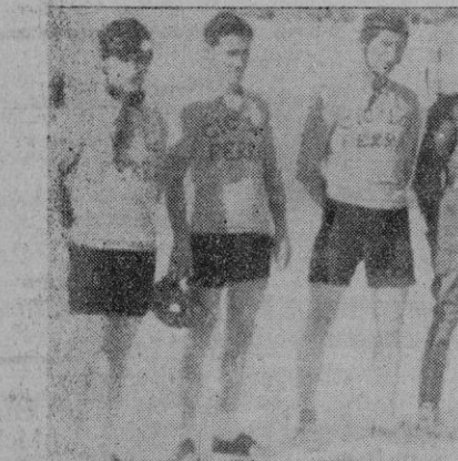
La selección mallorquina, poco antes de comenzar el «match»

En total los mallorquines puntuaron 22 puntos contra 14 de los peninsulares. En resumen, Mallorca ganó dos de las tres pruebas celebradas quedando por lo tanto vencedora total del match.