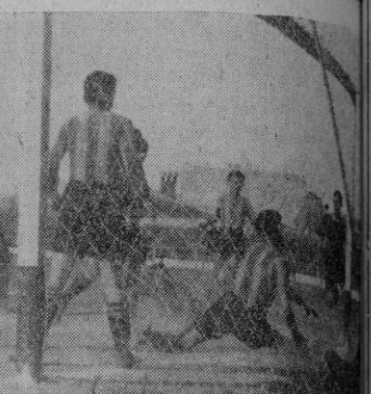
El equipo del «Mallorca», que ayer en «Buenos Aires», pese a ser vencido, produjo excelente impresión. — El primer tanto del «Mallorca», que el esfuerzo de los defensas manacorinos no pudo evitar.