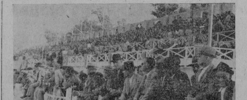
Espléndido aspecto que ofrecían ayer las tribunas del «Hipódromo», durante la gran jornada hipica

El sorteo para los partidos de cuartos de final, celebrado, en los locales de la Federación Na-