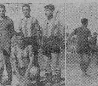
El equipo del «Mallorca», que ayer en «Buenos Aires», pese a ser vencido, produjo excelente impresión. — El primer tanto del «Mallorca», que el esfuerzo de los defensas manacorinos no pudo evitar.